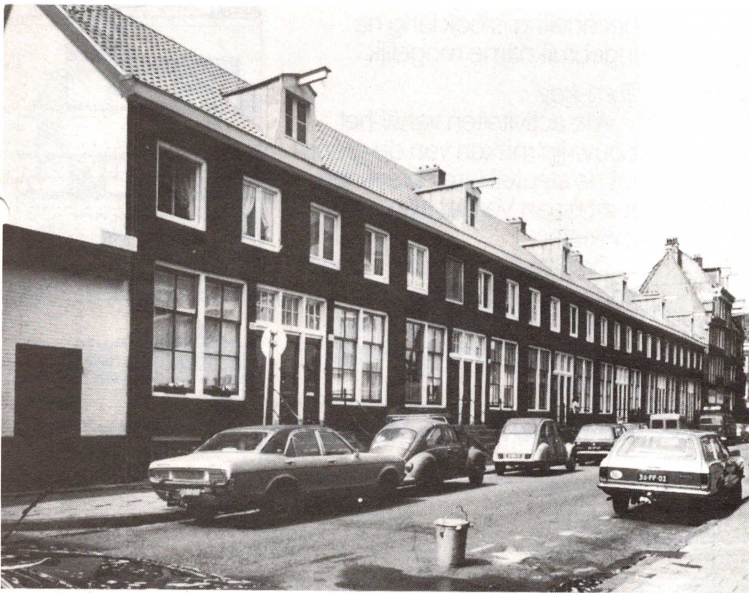
Amsterdam, Hoogte Kadijk 84-106 (zgn. Sibbelwoningen).

Dat de economische status van de bewoners belangrijk is,