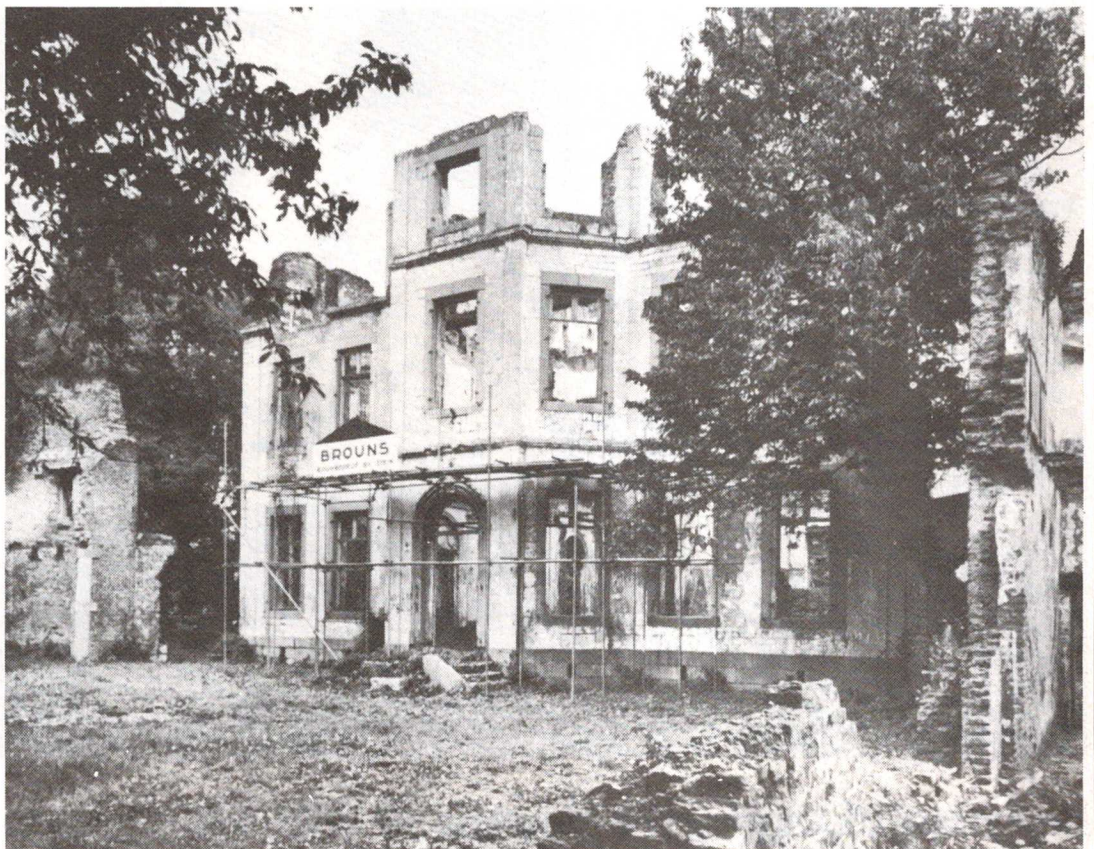
Obbicht, restauratie van het kasteel.