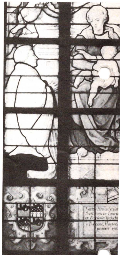
Gouda, St. Janskerk, detail van een gebi