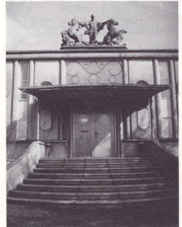
'De Holland van 1859' wordt met sloop bedreigd.

In de late jaren dertig kreeg Van Ravesteyn van de Spoorwegen 'dispensatie' voor de vele particuliere opdrachten die hem werden aangeboden, en ontstonden de Rotterdamse Zoo, Kunstmin en De Holland in Dordrecht en het interieur voor het koninklijke jacht Plet Hein. Een ware explosie van crea-