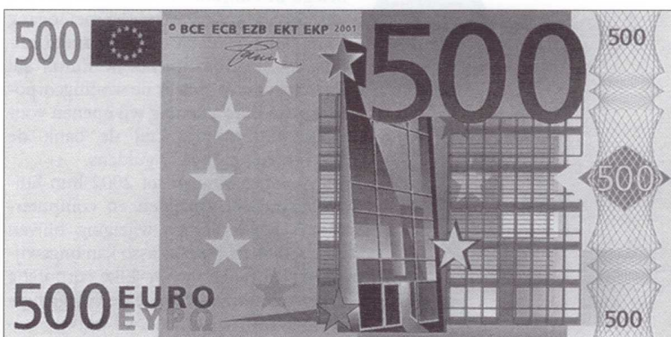
De Euro-bankbiljetten worden pas op 1 januari 2002 ingevoerd. (Bron afbeelding: Europees Monetair Instituut, 1997).